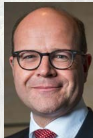
Oliver Schenk Chef der Staatskanzlei und Staatsminister für Bundes- und Europaangelegenheiten